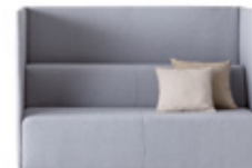
3 sided privacy screen Panel tapizado con 3 lados