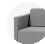
Upholstered arm 8cm Brazos tapizados 8cm