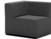
Corner seat Asiento rinconera 80x80cm