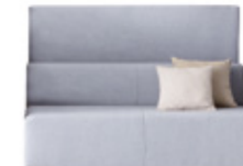
Back privacy screen Panel tapizado trasero