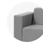
Upholstered arm 18cm Brazos tapizados 18cm