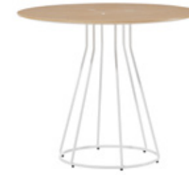
— Table Mesa