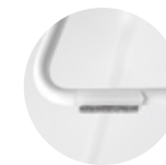
— Felt glides for sled Tacos fieltro para varilla