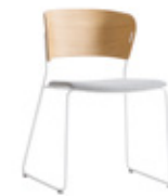
— Upholstered seat Asiento tapizado