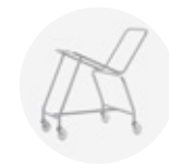
— Trolley Carro