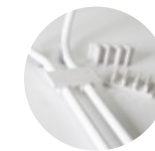
— Linking clips Clips de unión