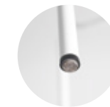
— Felt glides for tube Tacos fieltro para tubo