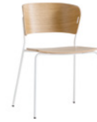
— 4 leg 4 patas