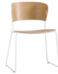
— Sled base Pie de varilla