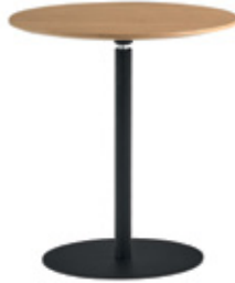
Round table Ø40cm Mesa redonda Ø40cm Table ronde Ø40cm