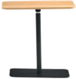
Rectangular table 35x55cm Mesa rectangular 35x55cm Table rectangulaire 35x55cm

La colección – The collection – La collection