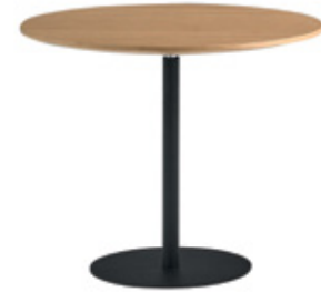
Round table Ø60cm Mesa redonda Ø60cm Table ronde Ø60cm