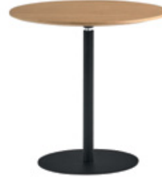
Round table Ø50cm Mesa redonda Ø50cm Table ronde Ø50cm