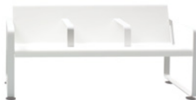
Intermediate arm Brazo intermedio Accoudoir intermédiaire