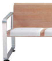
Upholstered seat Asiento tapizado Asise tapissée