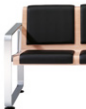
Upholstered seat and backrest Asiento y respaldo tapizado Asise et dossier tapissés